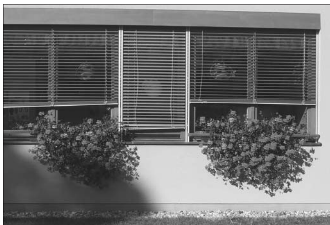
Dětský domov Lila