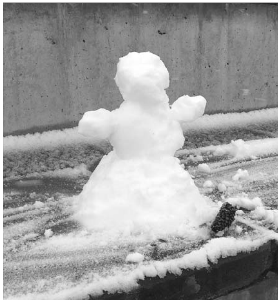
Budou letošní zimu děti v Otnicích stavět sněhuláka?