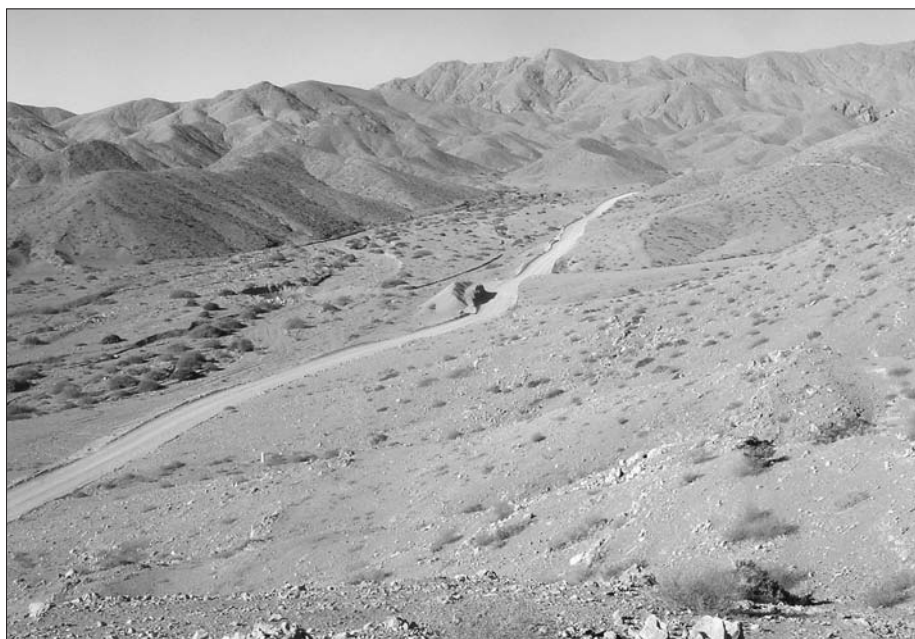
Krajina za Copiapo.