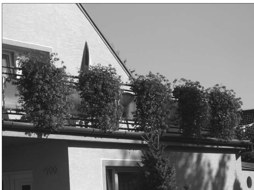
Boženy Němcové 400