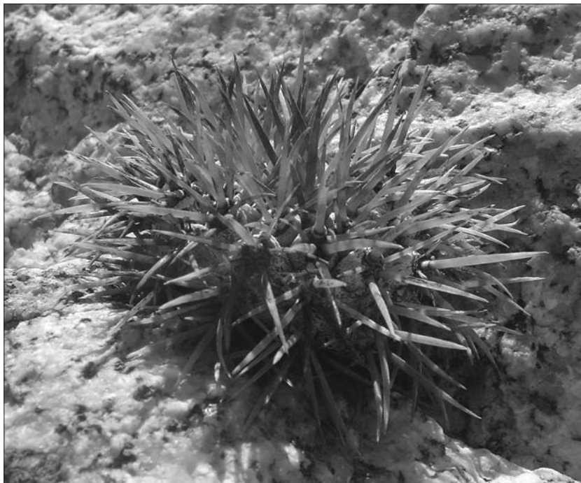
Copiapoa goldii .

Cestou zpět jsem se znovu vrátili do přístavu Cifuncho, kde jsme neúspěšně hledali malinkou rostlinku Copiapoa goldii . Podle dostupných informací tam prostě někde musí být. Naše cesta v Cifuncho vedla až na fotbalové hřiště (pokud se dá takto hovořit a uváleném písku se dvěma brankami), co však bylo zajímavější, že v těsné blízkosti hřiště byly takové malé ska-