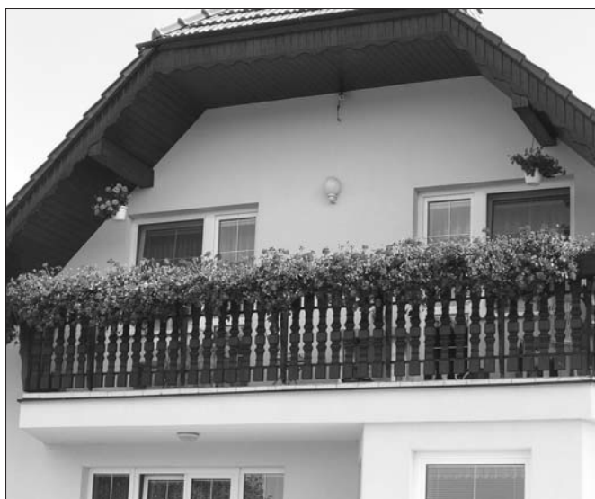
U Parku 154